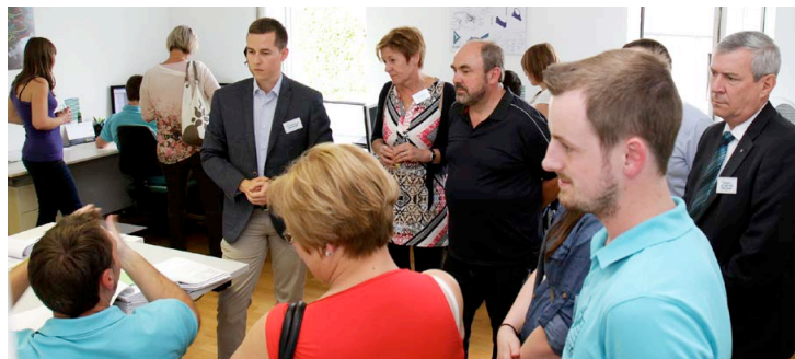
Interessierte Gäste informierten sich beim Firmenjubiläum der Schatz GmbH über die Arbeit des Naarner Ingenieurbüros.